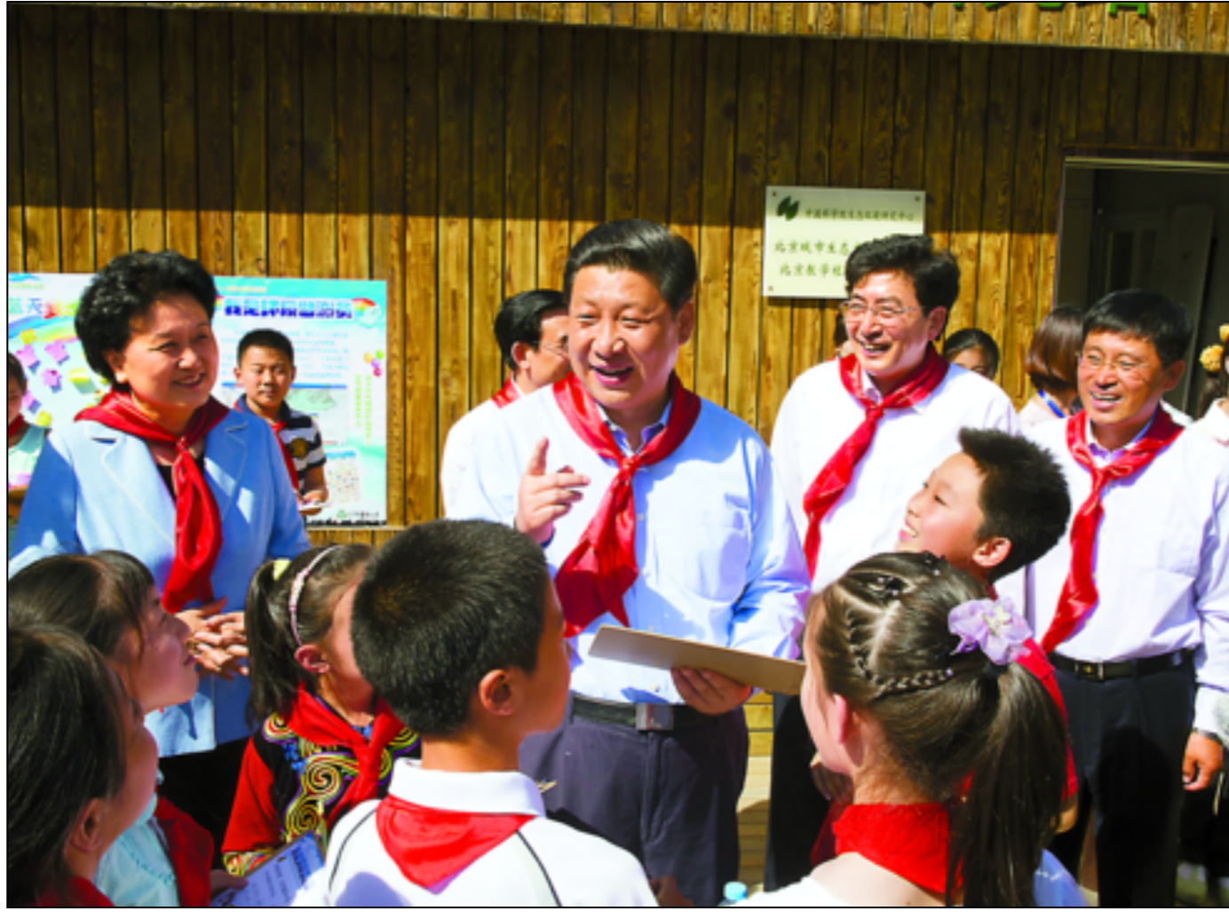
5月29日,习近平在和孩子们谈对环保的认识和理解。